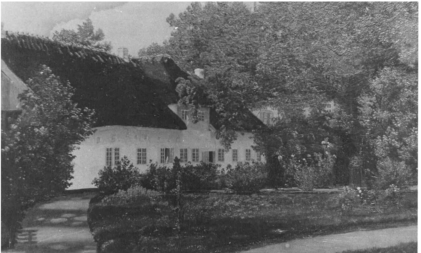
Præstegården i Stenløse, Fyn