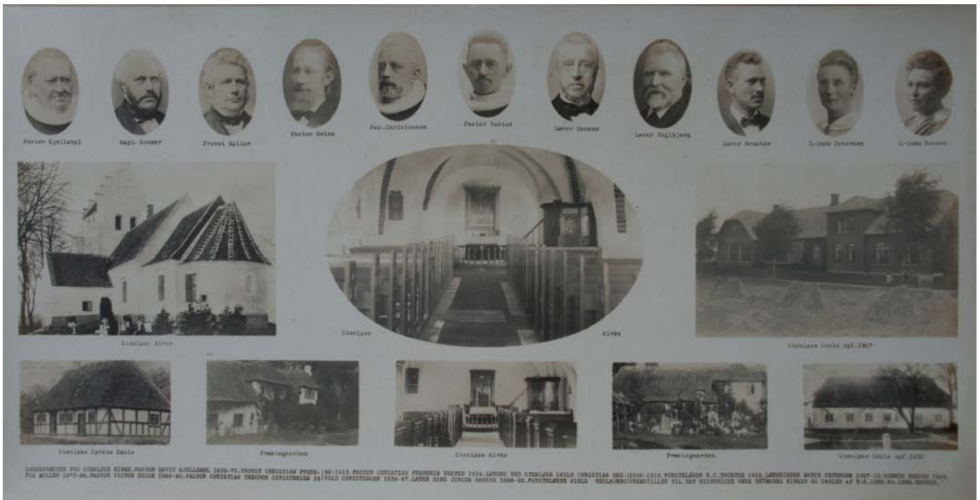
Folk af betydning i Stenløse Sogn anno ca. 1900.