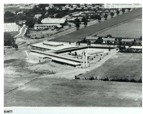
Skt. Klemens skolen i 1968