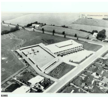
Skt. Klemens skolen i 1962

Den første del af Skt. Klemens skolen blev indviet i 1962. I 1968 stod læreværelserne færdige.