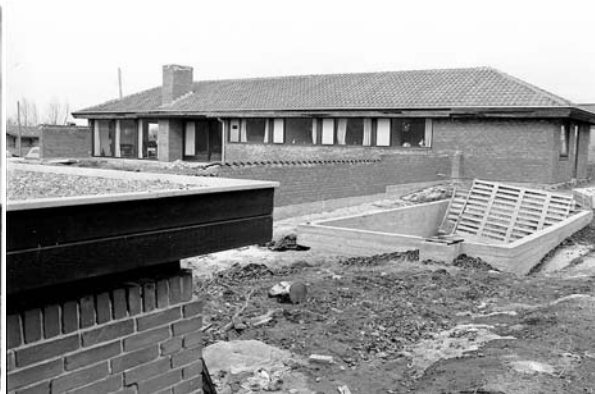
Årets hus 1969 – Skt. Klemens Vej 70